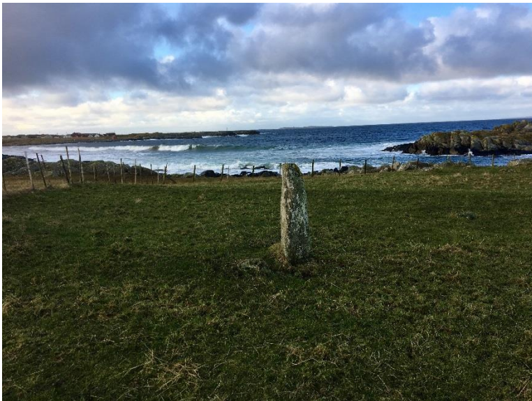
Ei av skjoldmøyane på Stavasletta.

Augvald hadde som vanleg med seg den heilage kua si. Han hadde også med seg dei to døtrene som var skjoldmøyar. Både Augvald og den heilage kua hans fall her i skåret på Stavaslettene. Då skjoldmøyane såg dette, sette dei i ville skrik, hoppa i ei elv og drukna. Sidan blei skjoldmøyane gravlagde på Stavasletta og steinar blei reiste over gravene deira. Ennå i dag blir desse steinane kalla "Skjoldmøyane" ( Skjelmeiane )