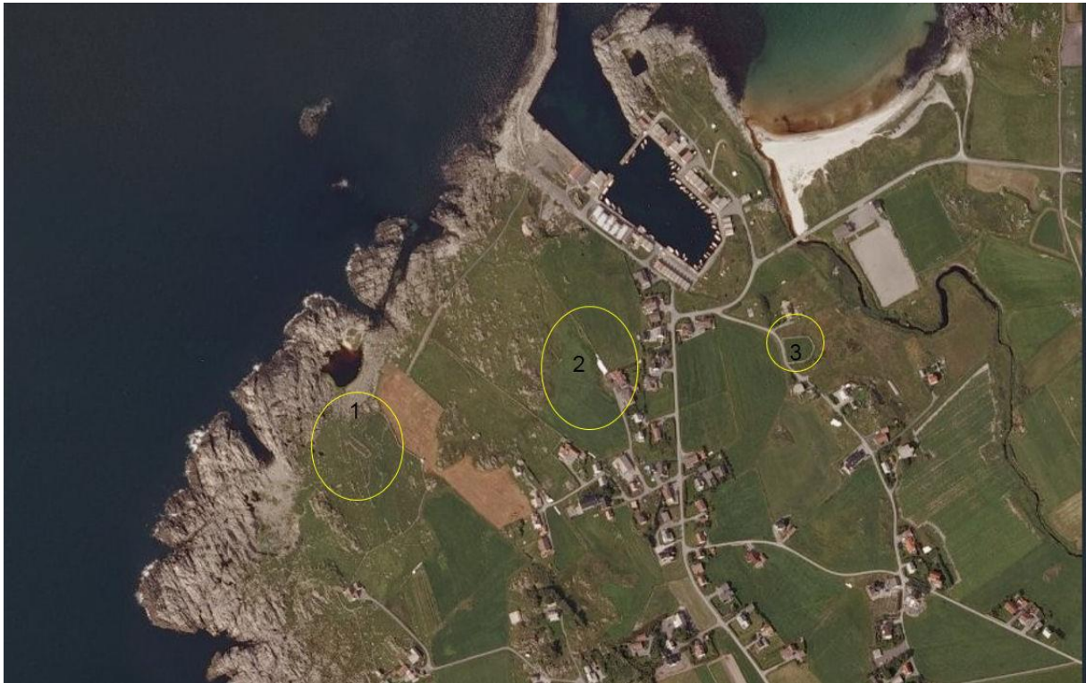
1. Naustanlegg m. naust, båtopptrekk, båtstø. 2. Område for "Kongsborgen" 3. Middelalderkirkegård

Segna fortel vidare at frå staden der Ferking er gravlagd, kan ein sjå Fløskjer nordanom Ur. Nokon nærare fastsetting av gravstaden gir ikkje segna, men folk har tenkt seg at Ferking ligg gravlagd i den store gravrøysa på Kvilhaug. Herifrå hadde sjøkongen fritt utsyn over sjøen så langt auga rakk, han kunne sjå heim til garden sin og han kunne sjå skjæret nordanom Ur som segna fortel om.